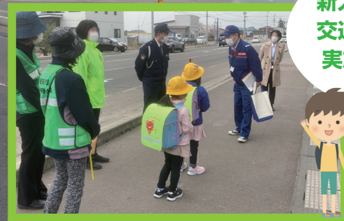
新入生を対象に交通安全教室を実施しました。