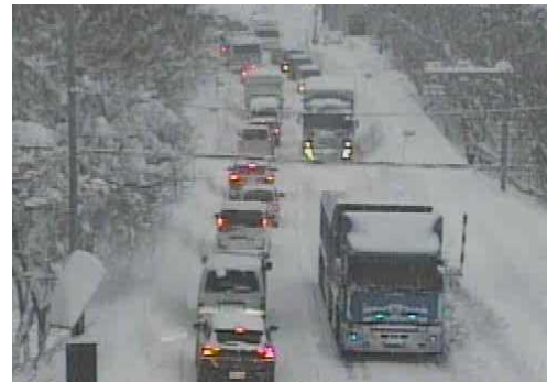
【写①】R3.12.27 国道4号の交通混雑状況