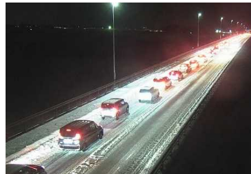
【写③】R4.1.4 国道7号の交通混雑状況