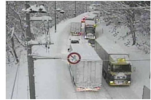
【写②】R3.12.28 国道7号の交通混雑状況