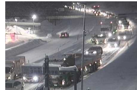
【写④】R5.2.1 国道4号の交通混雑状況