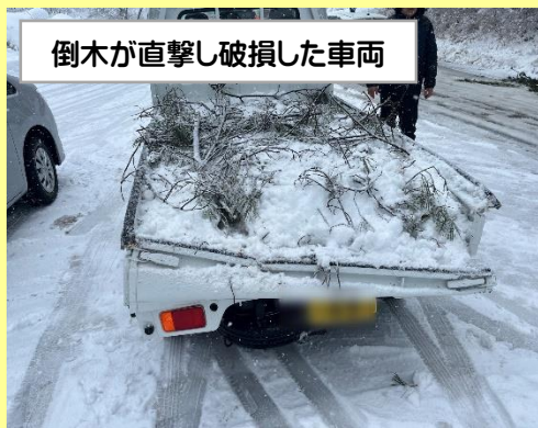
倒木が直撃し破損した車両