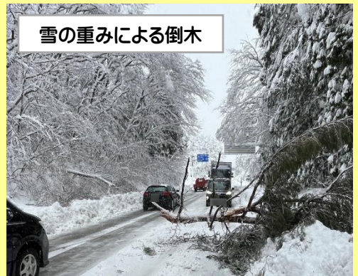
雪の重みによる倒木