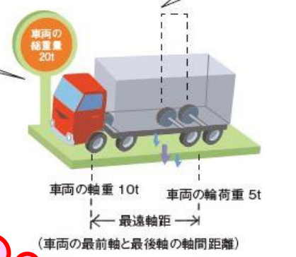
車両の総重量、軸重、隣接軸重および輪荷重

特殊車両を通行させる場合は、特殊車両通行許可証を携帯し、法令を順守して安全に走行しましょう！！