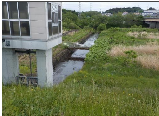
長苗代第二排水樋管川表 【土砂撤去後】