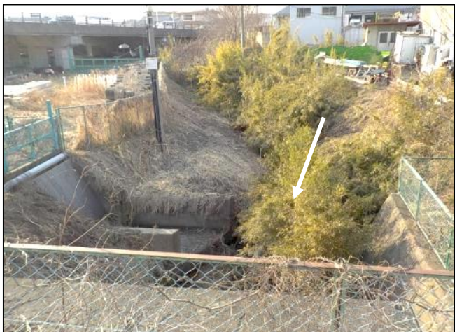
長苗代第二排水樋管川裏 【土砂撤去前】