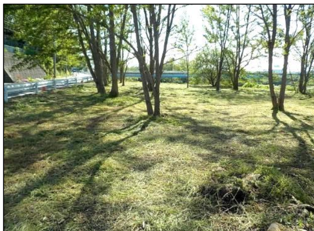
矢止めの清水(右岸3.8k)付近 【倒木枝処分後】