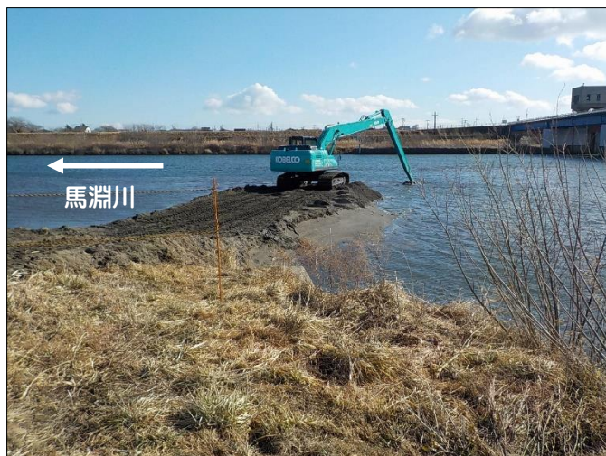
掘削した土砂で工事用道路を造ります