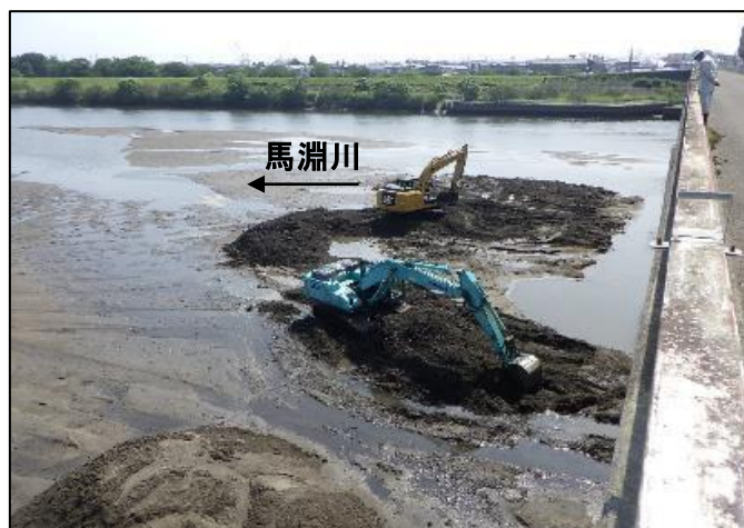
大堰下流側河床掘削状況