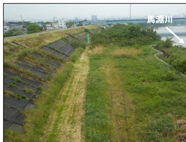
右岸魚道部【除草前】