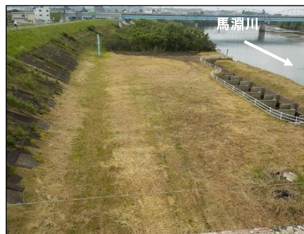
右岸魚道部【除草後】