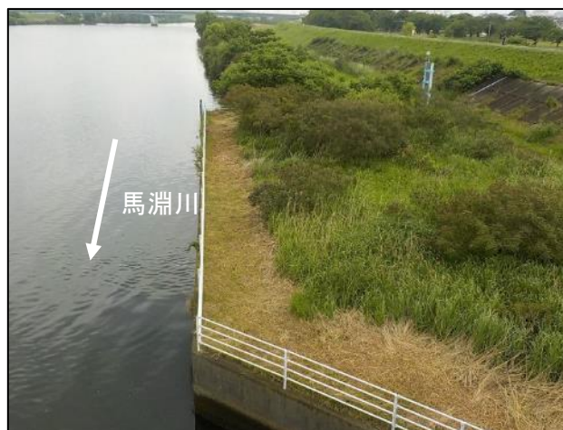
右岸魚道下流側【除草後】