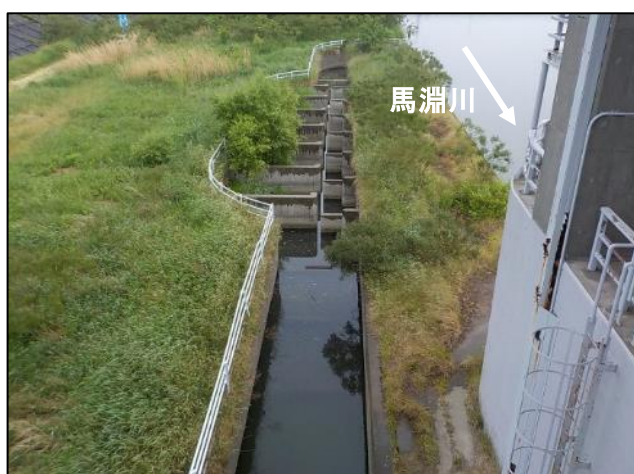
右岸魚道 【土砂撤去前】