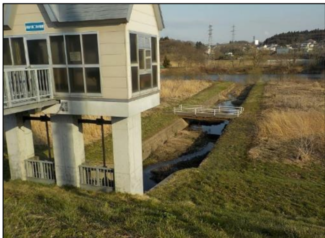
長苗代第二排水樋管川表 【土砂撤去前】