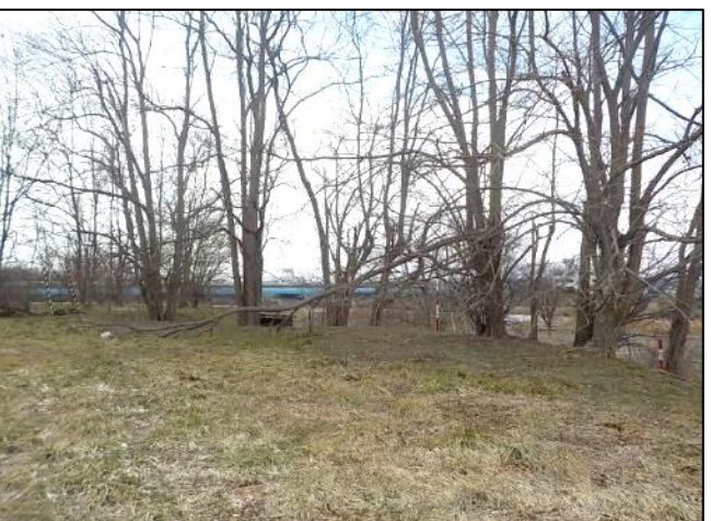
矢止めの清水(右岸3.8k)付近 【倒木枝処分前】