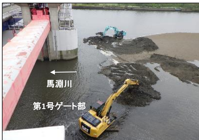
大堰上流側河床掘削状況