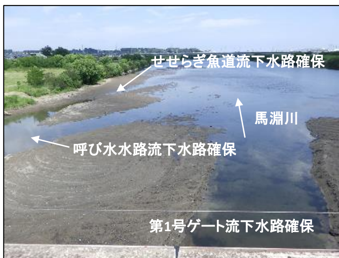
大堰下流側河床掘削後の状況 (各流下水路確保)