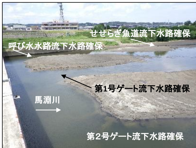
大堰下流側河床掘削後の状況