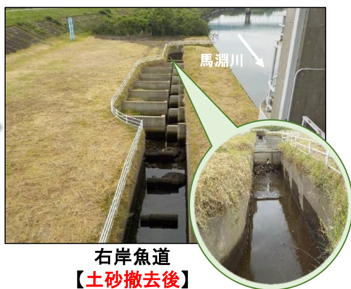
右岸魚道 【土砂撤去後】