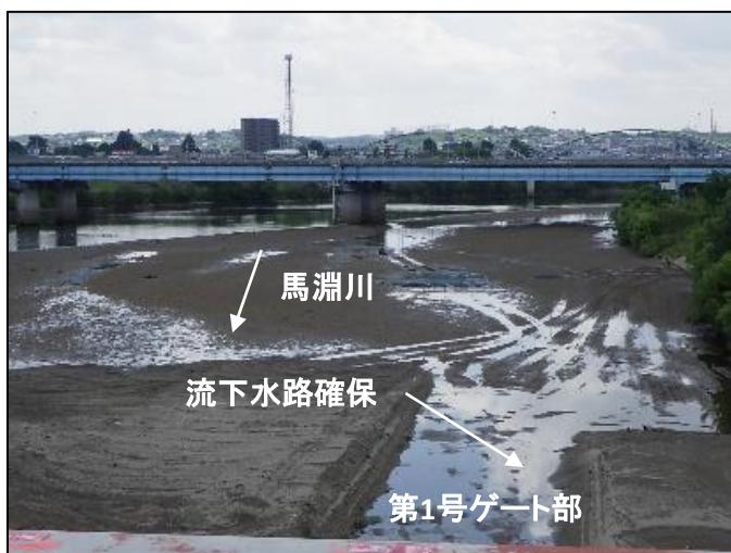
第1号ゲート流下水路確保状況