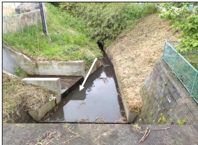
長苗代第二排水樋管川裏 【土砂撤去後】