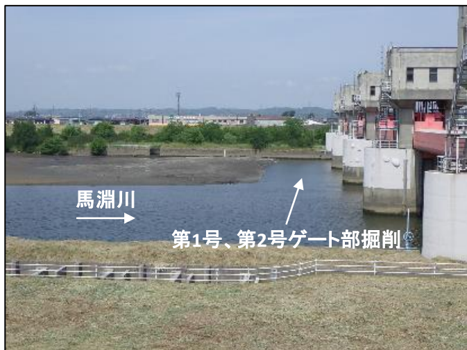
大堰上流側河床掘削後の状況