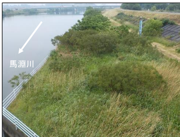
右岸魚道下流側【除草前】