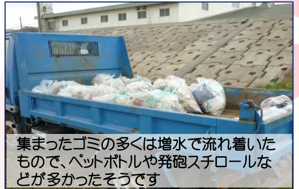
集まったゴミの多くは増水で流れ着いたもので、ペットボトルや発砲スチロールなどが多かったそうです