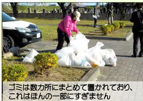
ゴミは数カ所にまとめて置かれており、これはほんの一部にすぎません