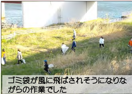
ゴミ袋が風に飛ばされそうになりながらの作業でした