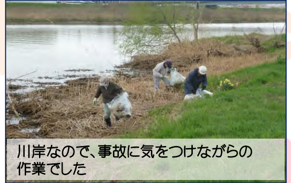
川岸なので、事故に気をつけながらの作業でした