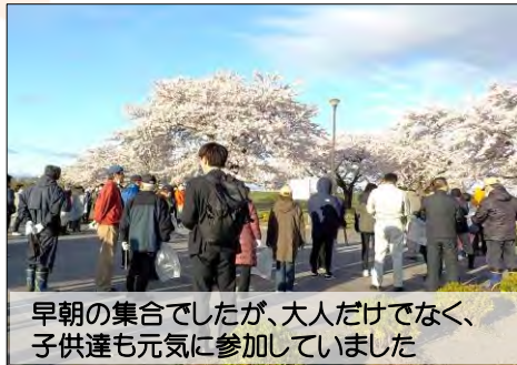
早朝の集会でしたが、大人だけでなく、子供達も元気に参加していました

4月20日(土)、沼館・城下地区の町内会、同地区の金融機関のみなさんが、右岸側JR鉄橋～新大橋下流周辺の約3kmを2班に分かれて清掃活動を行いました。当日は強い風が吹いていたにも関わらずたくさんの方が集まり、およそ1時間の活動で、たくさんのゴミが回収されました。