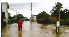
▲主要地方道弘前柏線の 冠水状況 (弘前市大川地先)