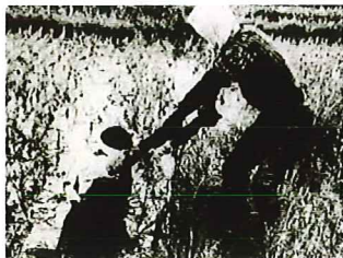
▲胸まで浸かる「乳切田」