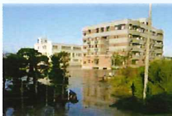
▲介護老人保健施設の 浸水状況 (弘前市大川地先)