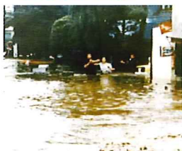
▲土淵川(弘前市川端地区) 昭和50年8月洪水