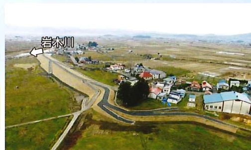
▲堤防整備後(平成29年3月)