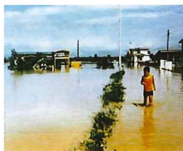
▲後長根川(弘前市中崎地区) 昭和52年8月洪水