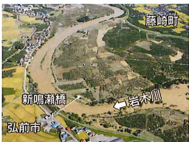
▲平成25年9月台風18号洪水 出水状況