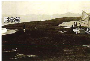
▲水戸口閉塞状況(大正14年8月2日)