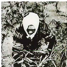
▲腰まで浸かる「腰切田」