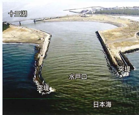
▲突堤完成後の水戸口