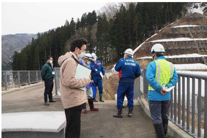
占有者との点検(津軽ダムパーク)