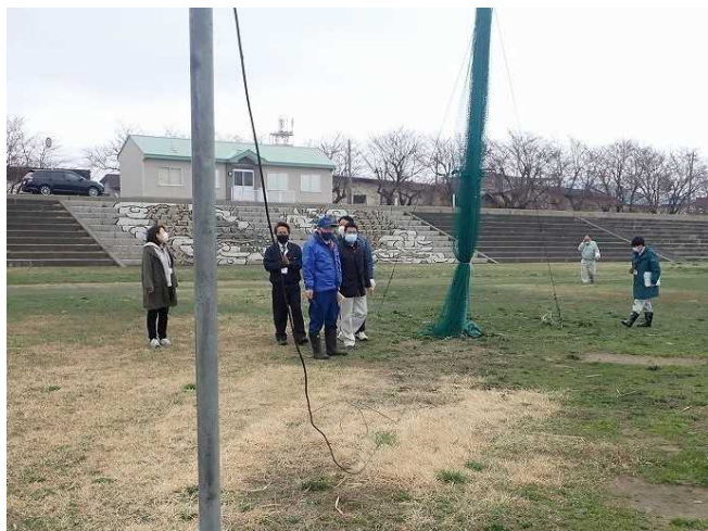
点検状況(北斗グランド)