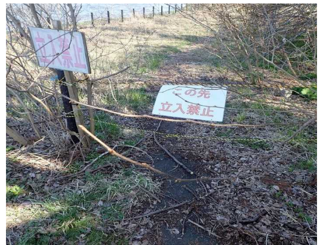
進入禁止ロープの交換(4月19日措置完了)