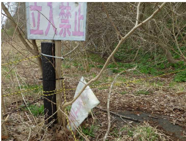
進入禁止ロープの切断