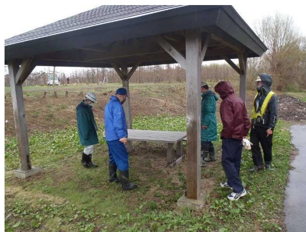
点検状況(みずべのわんぱく広場)