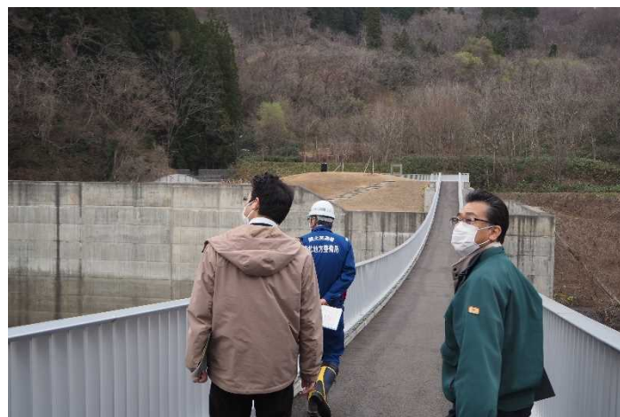
占有者との点検(白神が故郷橋パーク)