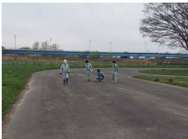
点検状況(馬淵川緑地公園)