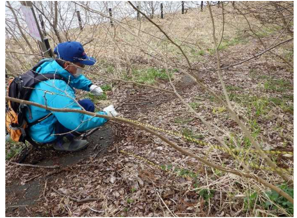
点検状況(小川原湖公園)