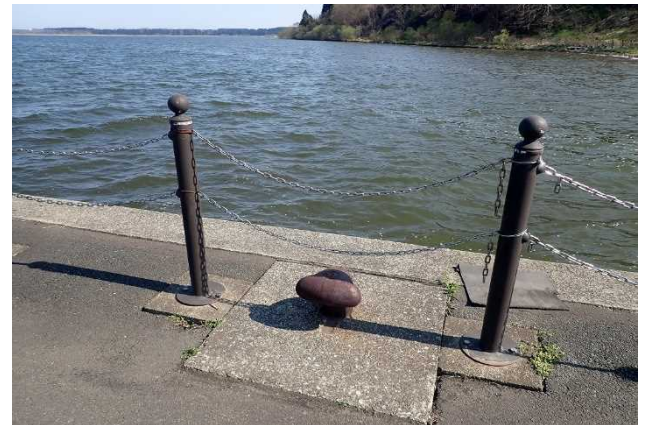
転落防止柵のチェーンの固定(4月19日措置完了)