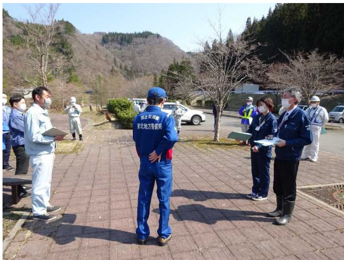
占有者との点検(水辺の広場)