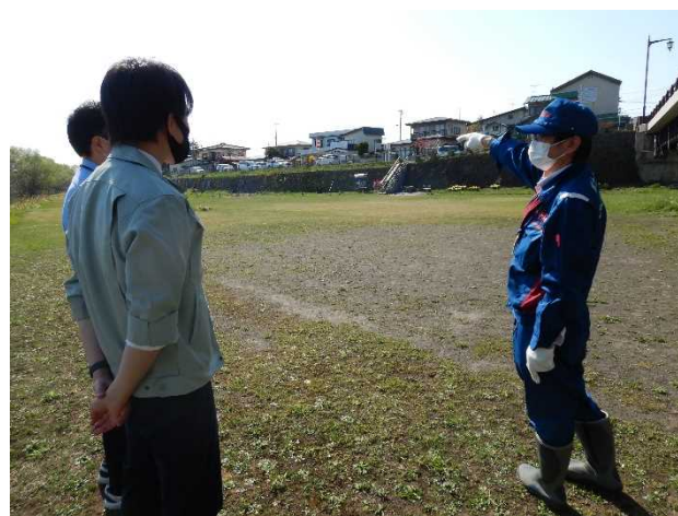
点検状況(藤代児童公園)