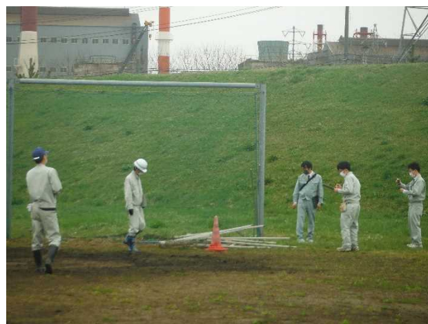
点検状況(馬淵川公園)