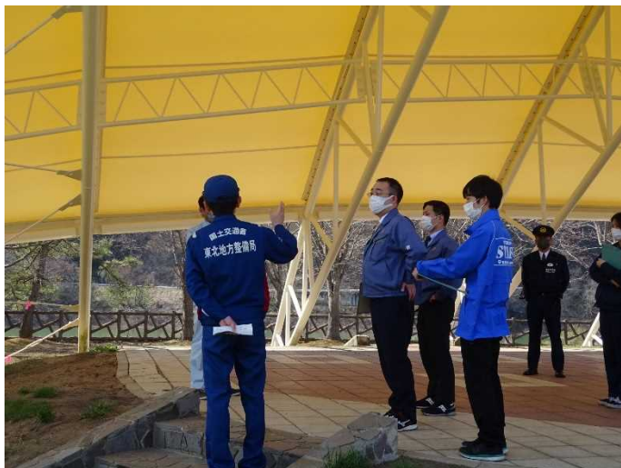
占有者との点検(虹の湖公園)