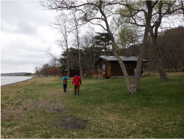
点検状況(ワカサギ公園)