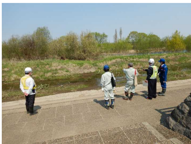
点検状況(せせらぎ広場)