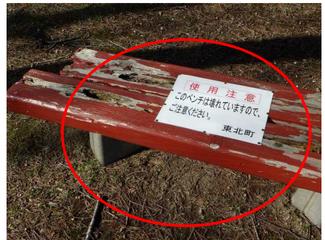
4月20日 貼り紙により注意喚起措置完了