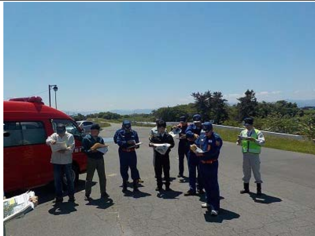
岩木川右岸43k (板柳河川公園) 岩木川が増水した場合 水防活動が必要とされる箇所