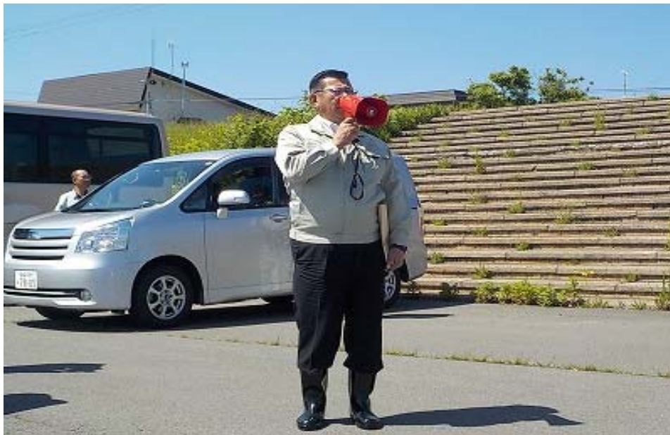
藤崎町長にも合同巡視に参加いただきました。