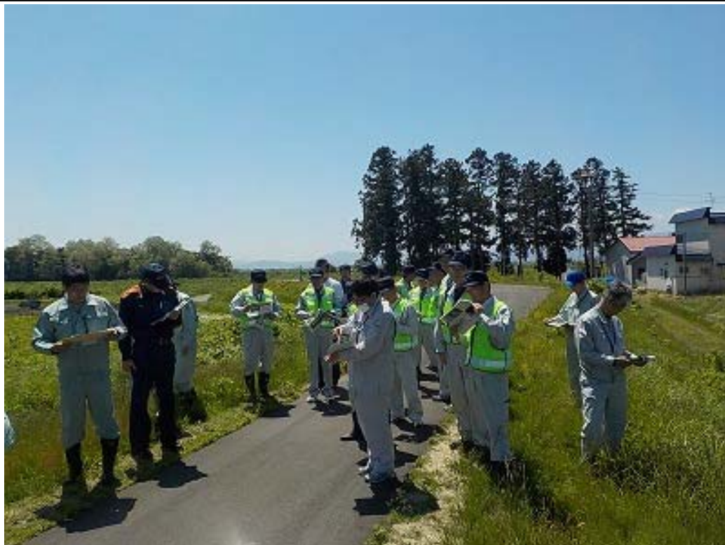
岩木川左岸45k (弘前市大川) 岩木川が増水した場合 水防活動が必要とされる箇所

本巡視の目的は、本格的な出水期を前に、行政機関と水防団が、出水の際特に注意を要する箇所を巡視し、情報共有と水防活動内容の確認を行うものです。今回は、関係機関に加えて、地域住民にも参加していただき実施しました。