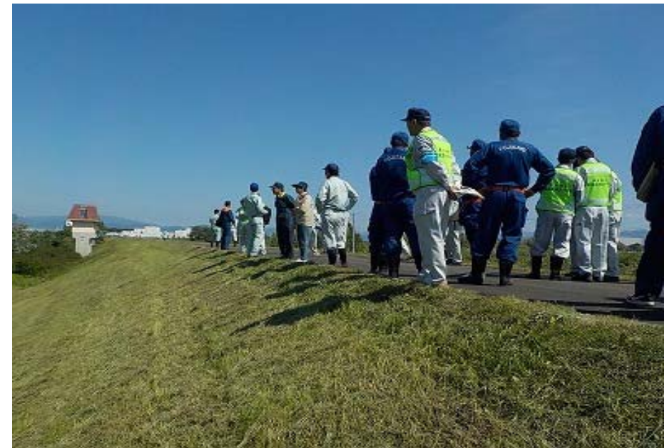
平川左岸1.6k（藤崎町大字藤崎） 一般の方にも参加していただき重要水防箇所を 確認していただきました。