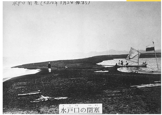
水戸口の閉塞 (53cm x 38cm)