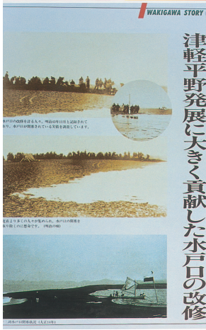
津軽平野発展に大きく 貢献した水戸口の 改修 (60cm x 43cm)