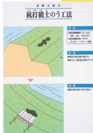
杭打積土のう工法 (42cm x 31cm)