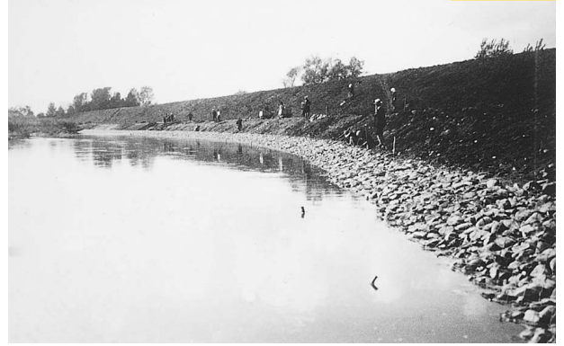
昭和4年11月 豊川護岸工事 (51cm x 42cm)