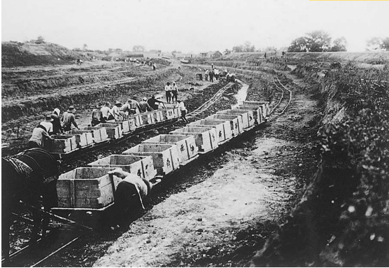
昭和5年8月 十川掘削工事 (51cm x 42cm)