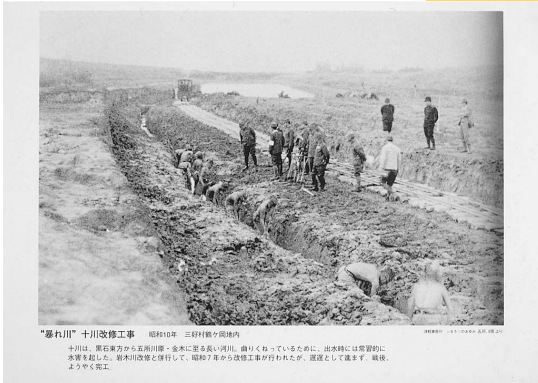
“暴れ川”十川改修工事 昭和10年 三好村高瀬地区 十川は、高松市方から五高川等・金木に至る長い河川、盛りくねっているため、出水時には常時的に 決壊を起した。岩木川改修と併行して、昭和7年から改修工事が行われたが、遅延として進まず、戦後、 ようやく完工。