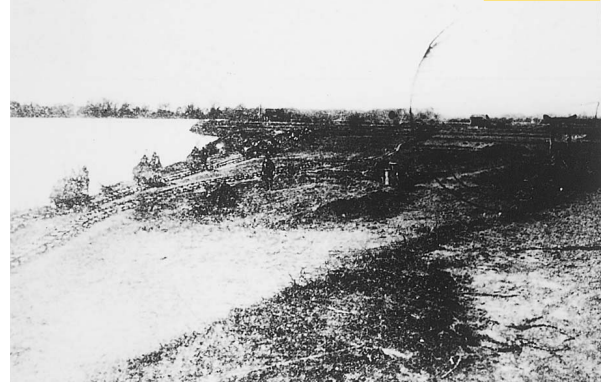
直轄工事着工 旧三好村高瀬地区 (51cm x 42cm)