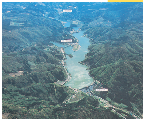
浅瀬石川ダム湖航空写真