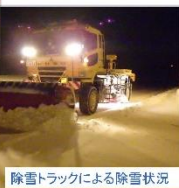
除雪トラックによる除雪状況 22