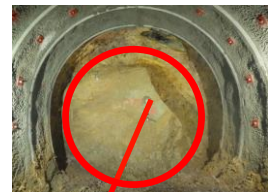
▼トンネルいっぱい大きな岩の塊▼

今後も、トンネル工事は引き続き無事故、無災害、安全第一で掘り進めてまいります。ご理解、ご協力のほど、よろしくお願いいたします。