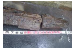
▼トンネル工事の際に出てきた木▼

現在掘削中の地層は、青樺山火山活動による火山噴出物である、火砕岩類（凝灰角礫岩、火山礫凝灰岩）などの、比較的固結が緩い箇所を掘り進んでいます。ただ、たまに大きな硬い岩の塊が出てきたり、先日などは3m程の「木」も出てきました！