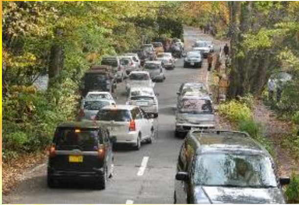
▲通常時の渋滞状況▲