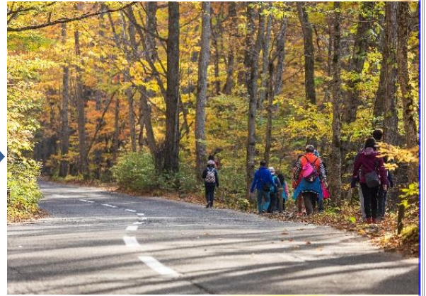
▲マイカー規制時(渋滞なし)▲

奥入瀬渓流は、紅葉時期などの観光シーズンに車が激増するため大渋滞が発生し、排ガスによって大切な自然環境にダメージを与えています。そして、紅葉を求めてやって来た観光客が自らの車によって奥入瀬渓流の魅力を低下させ、木々の美しさやせせらぎの音を存分に堪能することができないという悲しい現実があります。