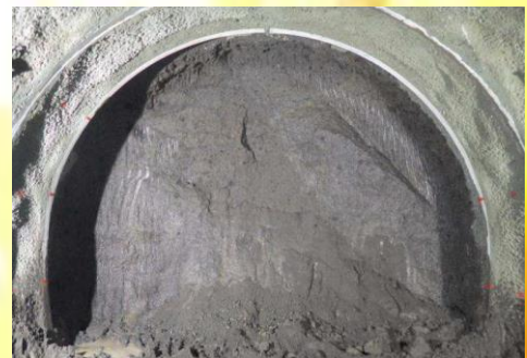
▲トンネル避難坑掘削面(H30.10.19撮影)▲

奥入瀬【青樺山】バイパス工事であるトンネル工事は避難坑を先行して掘削しており、11月4日現在で全長4,573mのうち1,351mまで進んでいます。