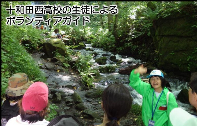
十和田西高校の生徒による ボランティアガイド