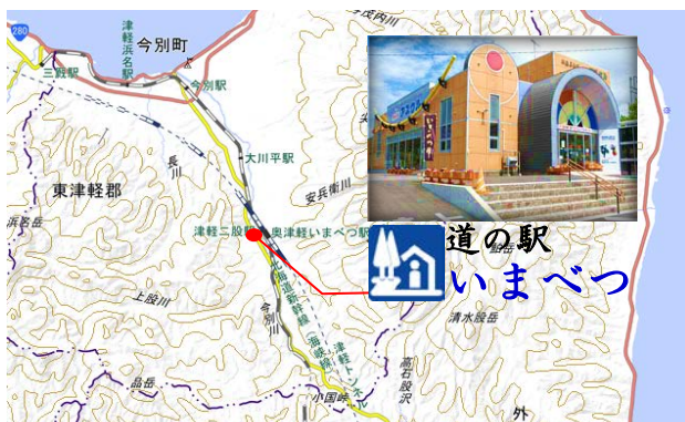
この地図は、国土地理院長の承認を得て、同院発行の電子地形図(タイル)を複製したものである。【承認番号 平29東棟 第33号】