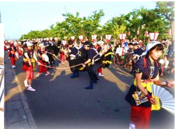
▲荒馬まつりを調査し観光客の誘導など課題を検証