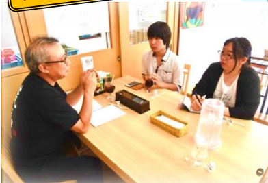
▲綿谷駅長へ聞き取り調査を行い新幹線の効果を検証