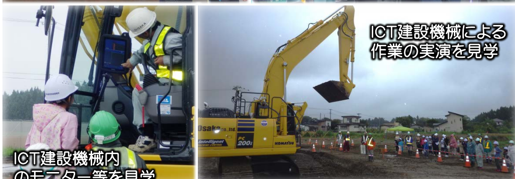
ICT建設機械内のモニター等を見学