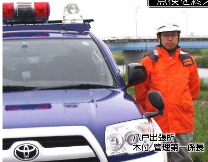
八戸出張所 木付 管理第一係長

「今回の点検で、施設管理者の皆さんが目頃からしっかりと整備をされていることが確認できました、ご協力ありがとうございました」