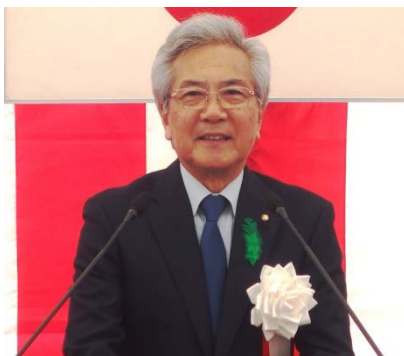
挨拶 葛西憲之 弘前市長