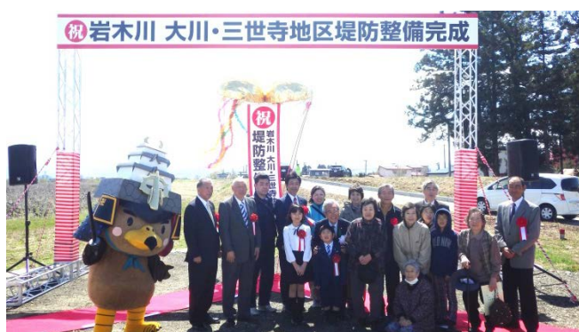
“完成を祝い” 地元関係者と記念撮影