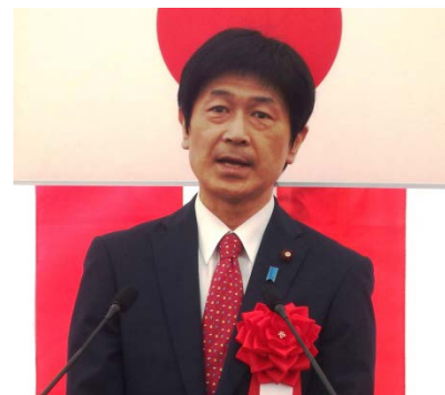
来賓祝辞 木村太郎 衆議院議員 地方創生特別委員長