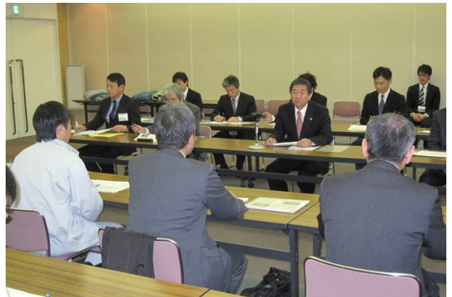
12/2 八戸市長とのトップセミナーの様子

今後は、H28年度末までに想定し得る最大規模に対応した浸水想定区域図を公表することや、河川防災情報ポータルサイトの活用推進等に取り組んでいきます。