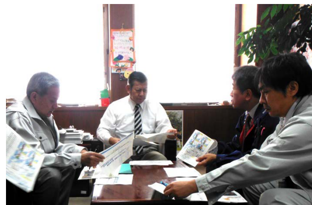
11/20 藤崎町長とのトップセミナーの様子