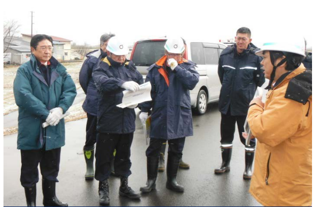
12/4 板柳町長との共同点検の様子