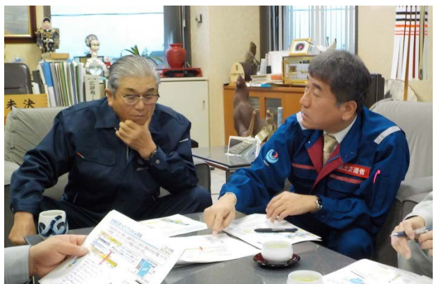
11/24 田舎館村長とのトップセミナーの様子