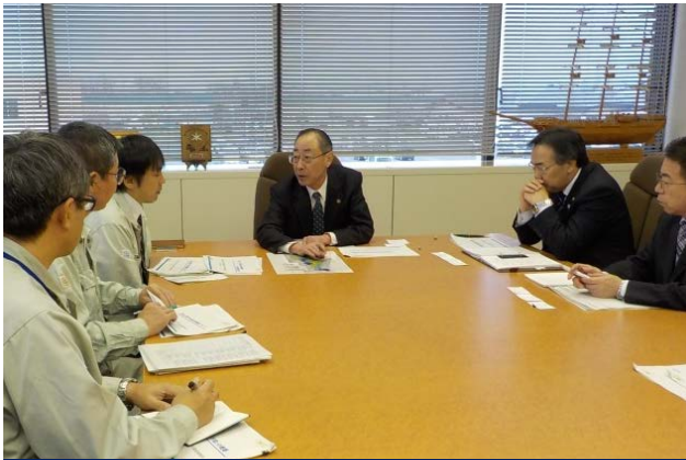
11/26 つがる市長とのトップセミナーの様子