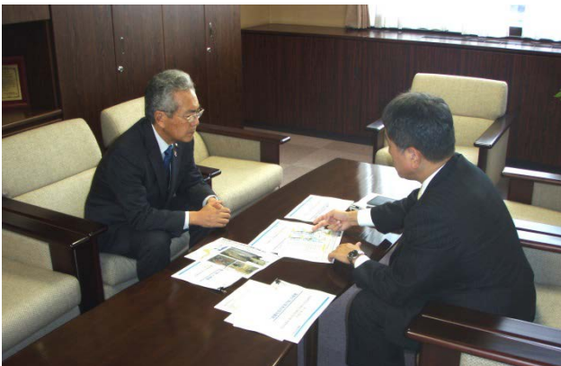
11/10 弘前市長とのトップセミナーの様子

また、洪水に対しリスクが高い区間については、住民への周知を目的とした市町村長、水防団、地域住民との『共同点検』も実施しました。