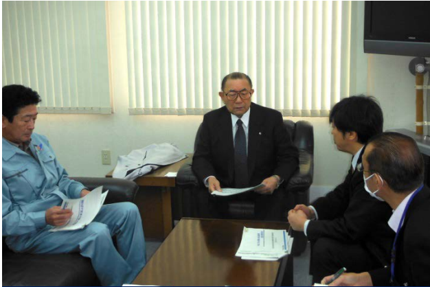
11/27 中泊町長とのトップセミナーの様子