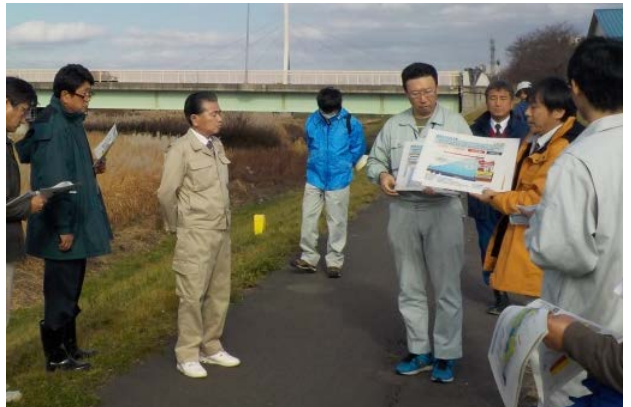
11/19 五所川原市副市長との共同点検の様子