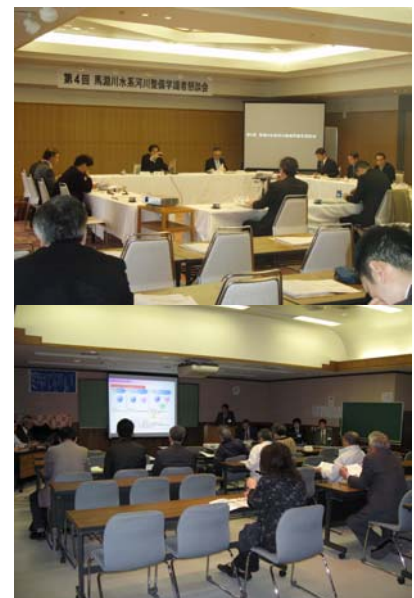
▲「馬淵川水系河川整備学識者懇談会」 ▼「地域の方々の意見を聴く会」