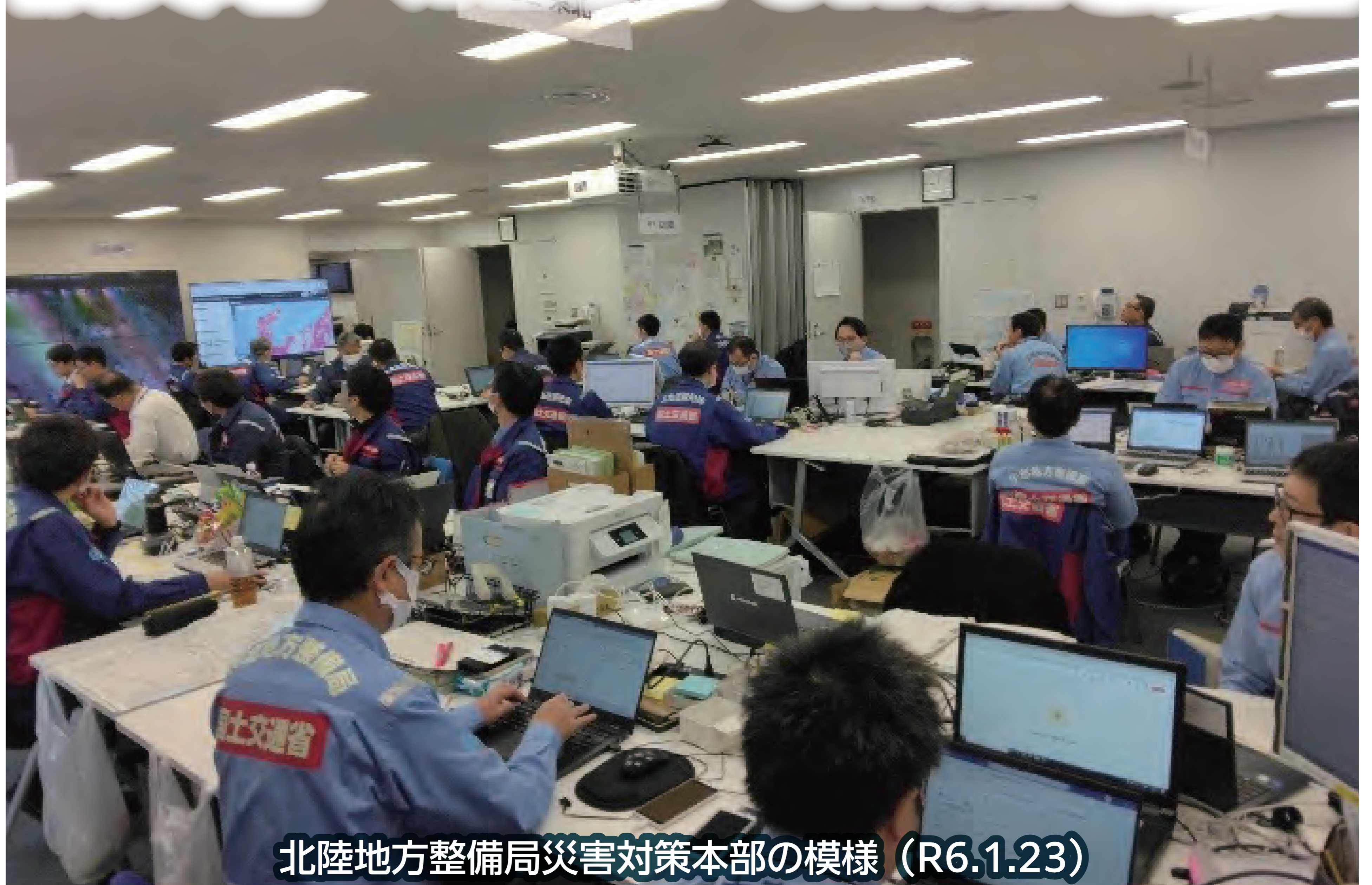
北陸地方整備局災害対策本部の様相 (R6.1.23)