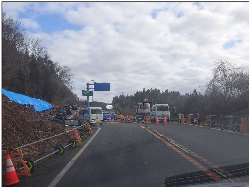
▲車線切回し(盛土崩落)