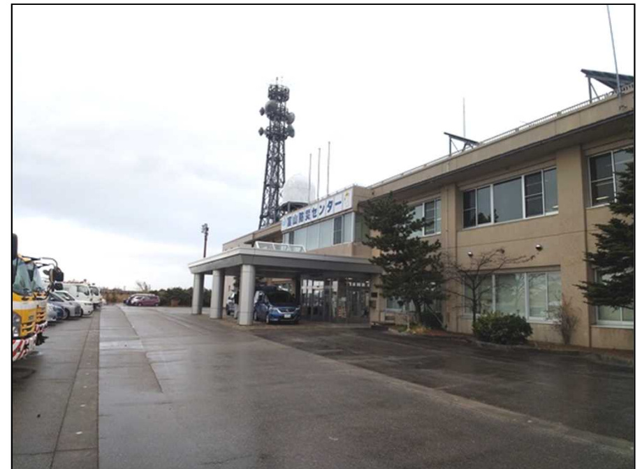
▲TEC拠点【北陸技術事務所富山出張所】