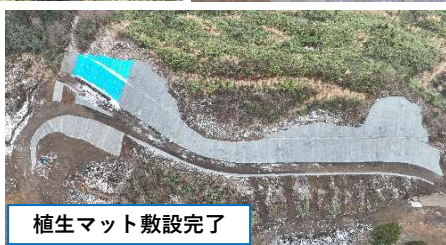
植生マット敷設完了