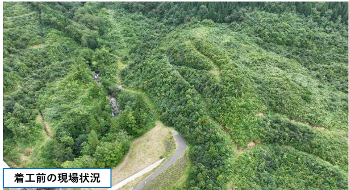
着工前の現場状況