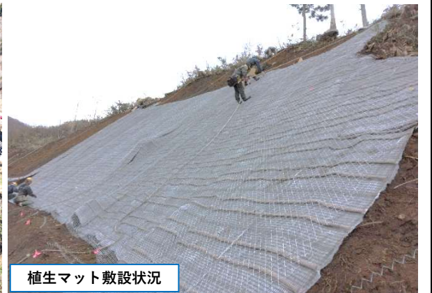
植生マット敷設状況