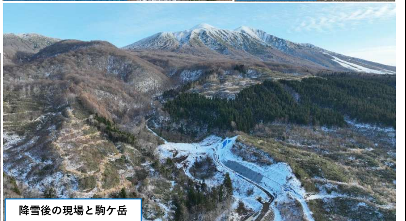
降雪後の現場と駒ヶ岳

11月は、管理用道路法面の掘削・整形、法面への植生マット敷設、工事で発生した残土搬出・運搬作業、後片付けを行っていきました。11月に入り、降雪・積雪を心配している中で上旬に降雪があり、作業の遅れが懸念される状況でしたが、大きな影響もなく計画通り作業を進めることができました。その後は幸い天候にも恵まれ、今年度の現場での施工を無事完了することができました。