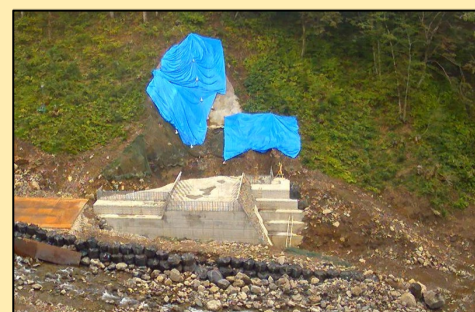
本体コンクリート打設