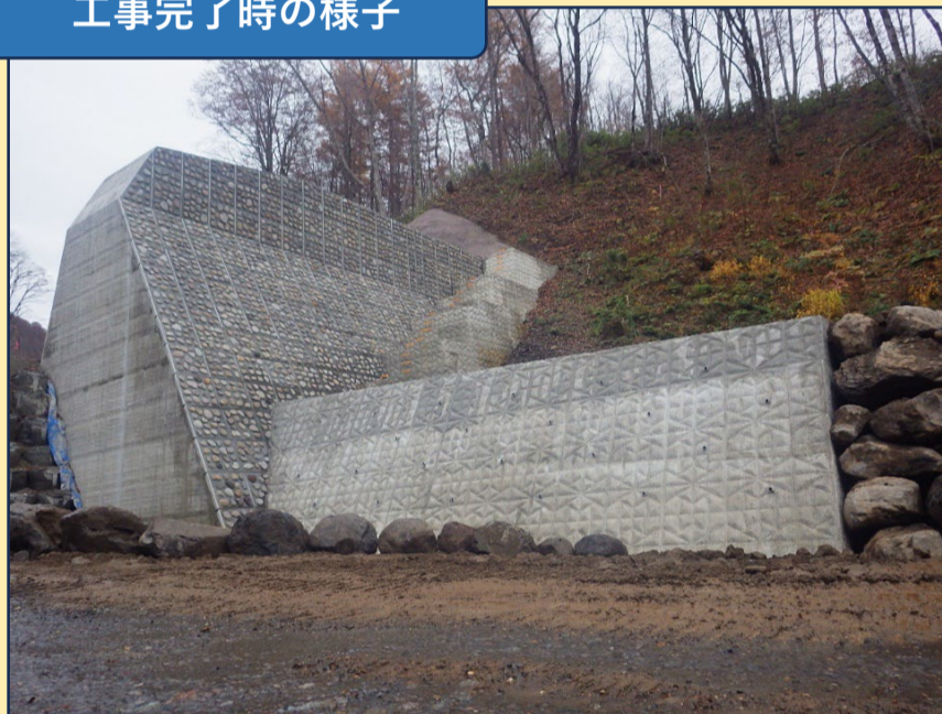
工事完了時の様子