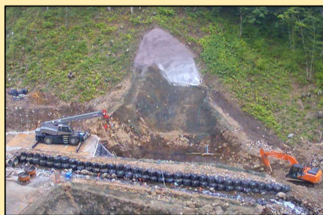
本体コンクリート打設開始 10月下旬