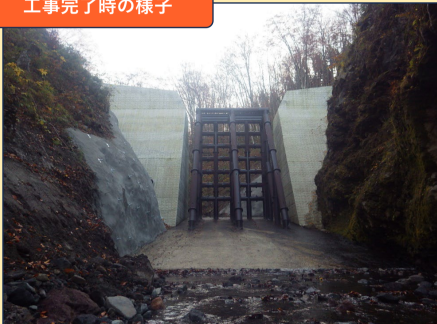
工事完了時の様子