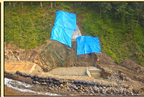
本体コンクリート打設 11月下旬