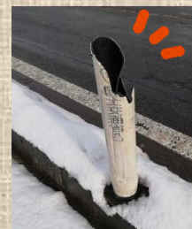
←↓交通事故で損傷した道路付属物