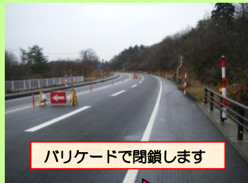
バリケードで閉鎖します