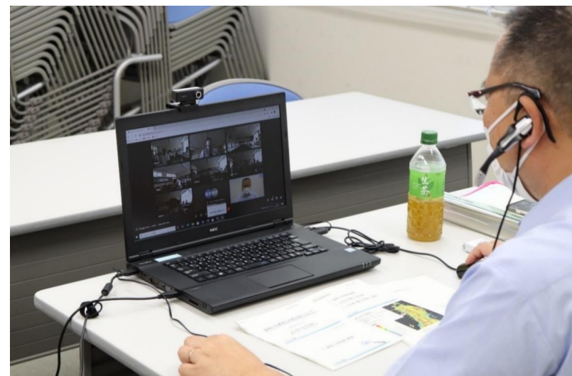
onlineによる講演の様子（湯沢河川国道事務所）

新型コロナ感染防止対策のため、講演は事務所と学校をオンラインでつなぎ、WEB方式により実施。