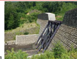
↑片倉沢第1砂防堰堤にて八幡平山系直轄砂防事業の説明 (湯沢河川国道事務所 伊藤出張所長)

※透過型鋼製スリットの砂防堰堤を設置し、下流域への降灰後土石流による被害の防止軽減を図る。