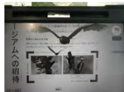
←タブレット→ に映し出される 3D画像