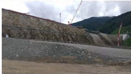
← KAJIMA DX LABO (展望デッキ)からの ↓ 成瀬ダム下流面を望む