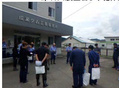
成雄物川流域治水協議会 作業部会 (成瀬ダム工事事務所 参集状況)