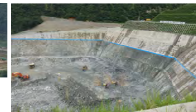
↑ 今年度で原石山掘削は終了