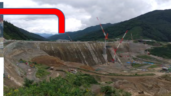
↑ 原石山展望台より堤体上流面を望む (ダム堤体施工状況)