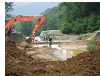
↑駒ヶ岳地区治山工事(嵩上げ工事)の説明 (林野庁 秋田森林管理署 小嶋総括治山技術官)

※既設治山堰堤の嵩上げを実施し、下流域への降灰後土石流による被害の防止軽減を図る。