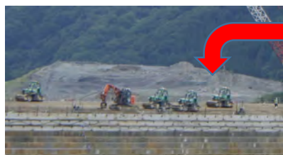
↑ 自動振動ローラによる締めめ状況