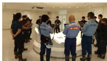
↑ KAJIMA DX LABO (ジオラマ前)にて