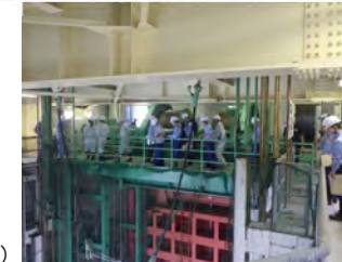
↑玉川ダムの概要説明 (玉川ダム管理所 水木管理係長)