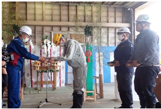
▲ 米沢国道維持出張所長から維持業者へ除雪機械の鍵が引き渡されました。