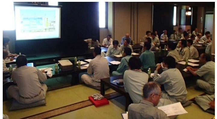
▲現場点検の写真をしながら検討会を実施