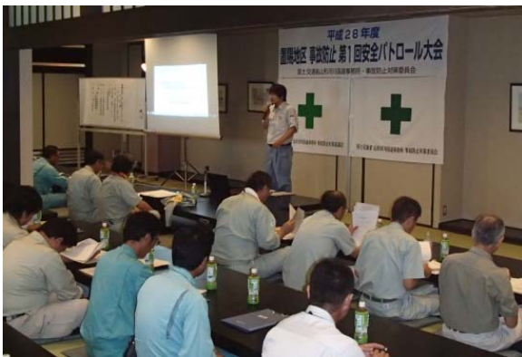
▲米沢労働基準監督署による安全講話