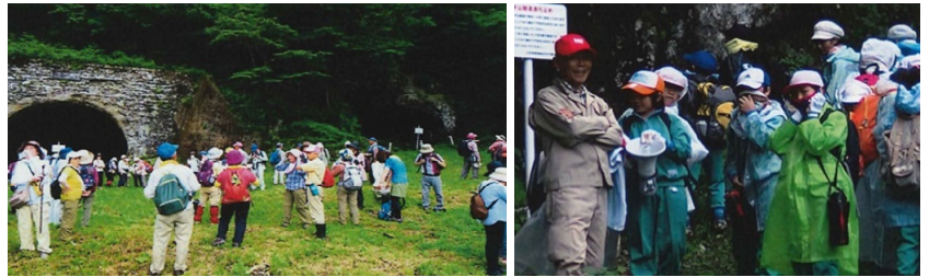
▲散策会での福島・山形の交流活動