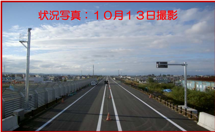
状況写真：10月13日撮影