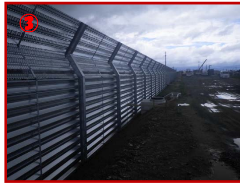
↑防雪柵支柱建て込みからパネル設置完了まで