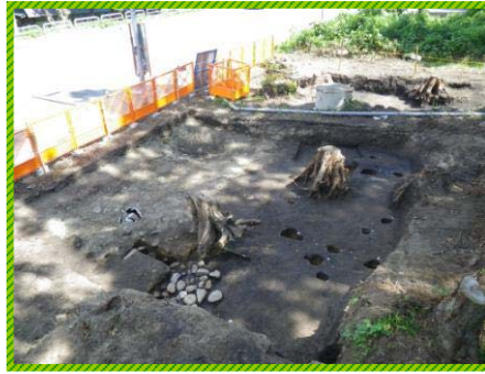
発掘調査完了の様子

土塁 とは敵や動物の侵入を防ぐため、古代から中世にわたって城や豪族の住居、集落などの周囲に築かれた連続した土盛りのことです。この土塁の高さは約1.8mありました！