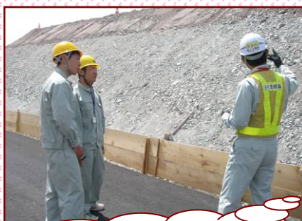
3日に東北中央自動車道の工事現場で、施工管理や現場監督業務を体験しました!

6月14日～16日に、県立米沢工業高等学校の2年生2名が、米沢国道維持出張所にて就業体験学習(インターンシップ)を行いました。工事現場の監督や河川・道路のパトロールや仕事の進め方などを体験してもらいました。実際に見たり触れたりすることで、学校では学べない貴重な体験をできたのではないのでしょうか。この経験を今後の役に立ててもらえればと思います!