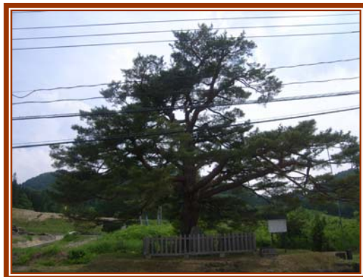
平成 21 年 3 月 17 日 山形県景観重要樹木第1号 平成 22 年 4 月 1 日 米沢市景観需要樹木第1号 に指定される

米沢市万世町桑山(旧万世小学校跡地)に一本松があります。明治14年明治天皇が東北御巡幸の際に休憩された場所として、この地を永く後世に伝えるために、明治22年に記念樹として青松一株が植えられたものです。『万歳の松』の樹齢は推定約200年で、樹高13メートル・枝張り約20メートルと均整がとれ威厳を備えた姿をしています。