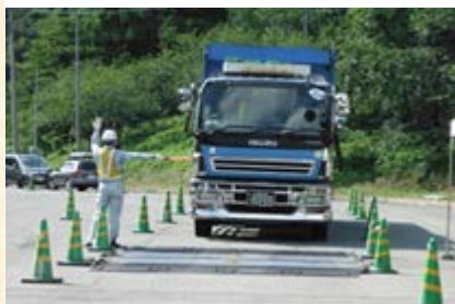
マットスケールの上へ