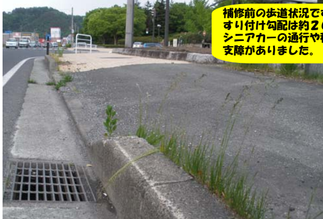
補修前の歩道状況です。 すり付け勾配は約20%（11度）ときつく、 シニアカーの通行や積雪時の歩行などに 支障がありました。