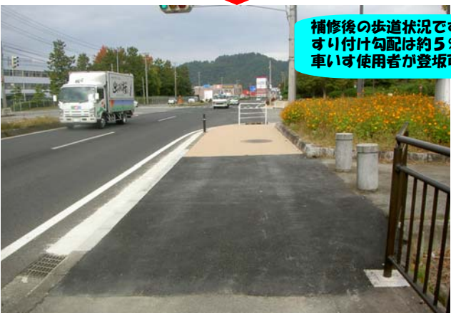
補修後の歩道状況です。 すり付け勾配は約5%（3度）と緩勾配になり、 車いす使用者が登坂可能に補修しました。