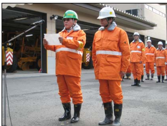
安全宣言！ 山形国道北地区維持工事 現場代理人 山形国道南地区維持工事 現場代理人