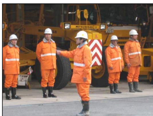
除雪車の点検（南地区）