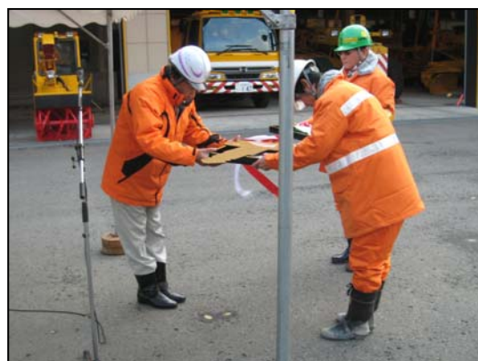
除雪車の鍵の引渡し