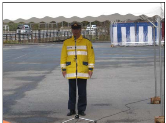
村山警察署 交通課長より挨拶を頂きました。