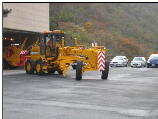
除雪車出動！ 北地区は関山トンネル（仙台市）方面に、南地区は国道13号（天童市）に向かって出動していき ました。