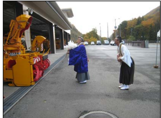
除雪車も御祓いをして頂きました。