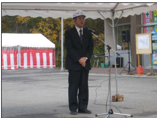
山形河川国道事務所長より激励の挨拶