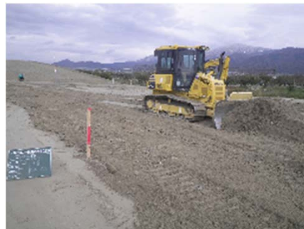
▲ MCブルドーザによる敷均し状況