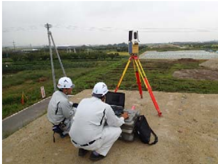
▲ レーザースキャナーによる起工測量