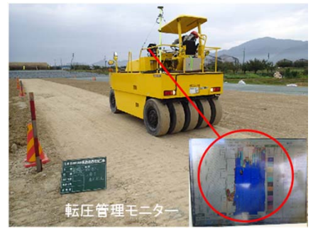
▲ 転圧管理システム搭載タイヤローラ