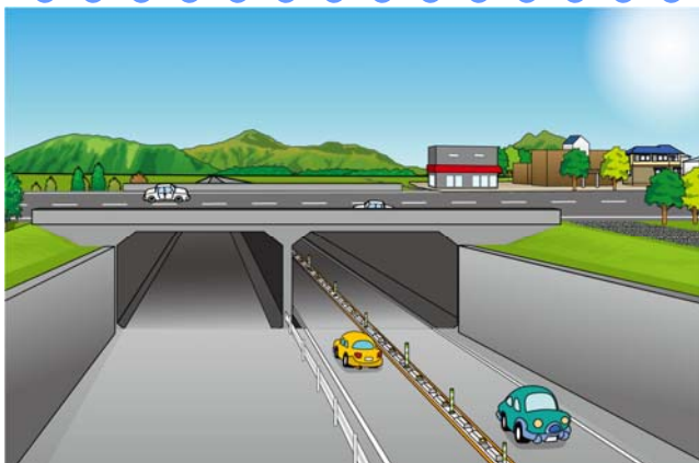
【完成予想図】当面は、右側（西側）2車線の整備を進めます。