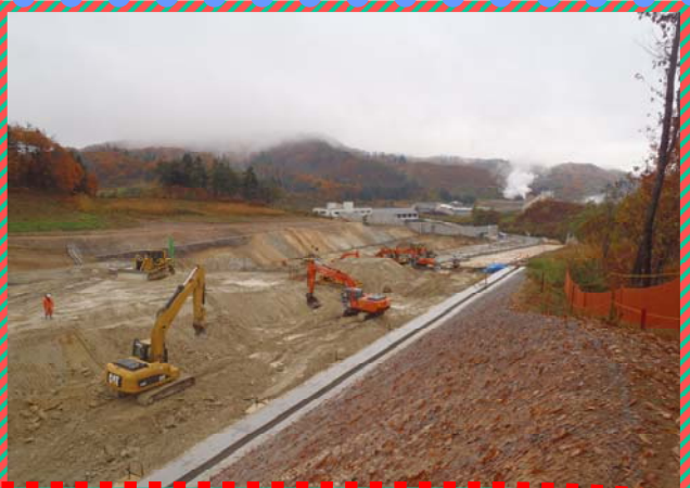
大石田ゴルフ場東側南斜面の切土状況です。掘削した土砂は東根IC付近や村山市の盛土場へ運搬しております。（大石田町今宿地内）