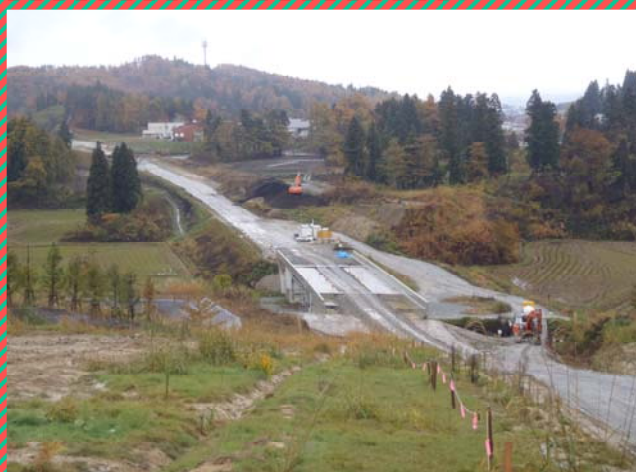
（左写真）大石田ゴルフ場東側北斜面の切土状況です。手前に見えるのが五十沢川橋で工事が完成し土運搬路として使用しております。（大石田町今宿地内） （右写真）切土箇所から尾花沢市方向を見た写真です。道路の形が判ると思います。