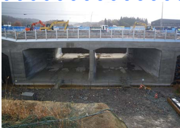
【工事状況】トンネル本体の状況です。 （幅28.3m・高8.3m・長33.0m）