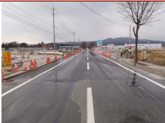
尾花沢市側（東側）から大石田町側（西側）を望んだ写真です。左側に見えるのが迂回路です。

市道南原大石田線の通行を3月末に迂回路へ切替えし、箱形トンネル工事を進めて参りましたが、工事の一部が完成したことから、通行を11月30日に本線へ切替えするとともに、市道の工事も12月下旬に完成させることができました。工事中は通行するドライバー及び歩行者の皆様にはご不便をおかけしました。御協力ありがとうございました。（関連記事 第15号・第19号）