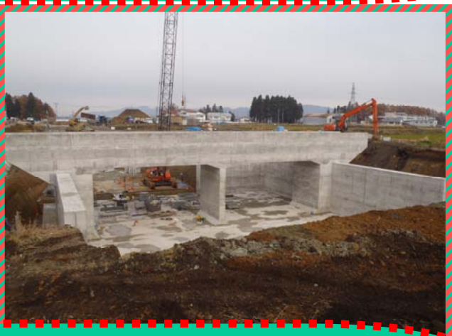
（左写真）尾花沢市丘陵部、擁壁工工事の状況です。（北側より南側を望む） 奥に臈気川橋及び切土部（大石田町鳥木沢地内）が見えます。 （右写真）尾花沢市丘陵部、水路付替用箱形トンネル工事の状況です。 左側2車線の整備を進めます。（南側より北側を望む）