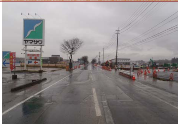
大石田町側（西側）から尾花沢市側（東側）を望んだ写真です。右側に見えるのが迂回路です。