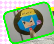
♪金メダルをもらいました♪