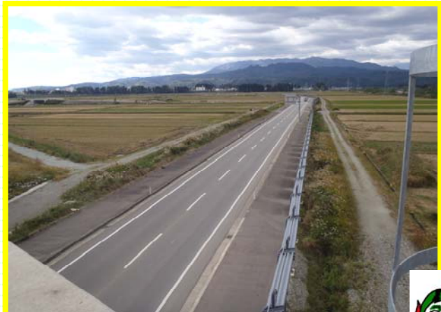
田町こ道橋より国道347号がこんな感じで見えます。左側が尾花沢市内、右側が大石田町方面です。