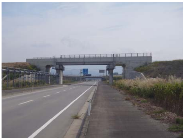
【田町こ道橋L=22m】国道347号を横断

左からJR奥羽線、尾花沢新庄道路、国道13号、県道東根尾花沢線（旧国道13号）となります。