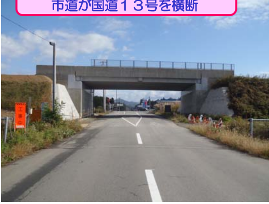
【荻袋第一こ道橋 L=19m】 市道が国道13号を横断