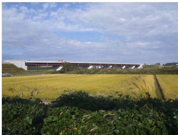
【丹生川橋L=244m】丹生川を横断