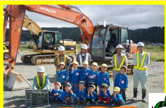
♪みんなで記念撮影♪