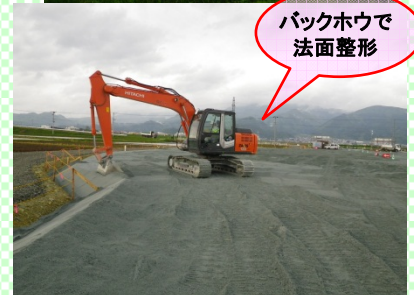
バックホウで法面整形