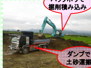
バックホウで掘削積み込み