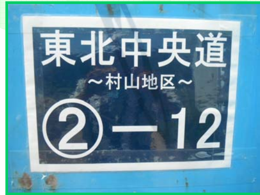
背面にプレートを設置している状況