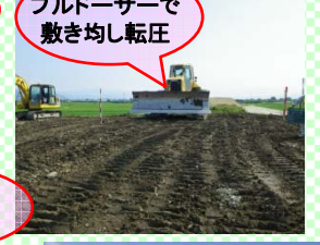
ブルドーザーで敷き均し転圧