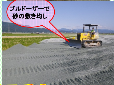
ブルドーザーで砂の敷き均し