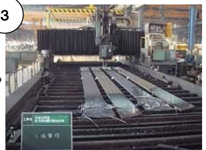
現場で橋を組み立てる時に使用するボルト用の孔をあけます。