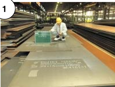
橋に使用する鋼材を購入します。 (工場は新潟県聖籠町)