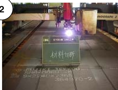
設計図の寸法にあわせ鋼材を切断します。