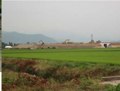
■東根市羽生地区現場 (盛土場)