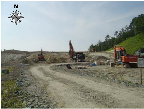
■大石田町今宿地区現場（掘削場）