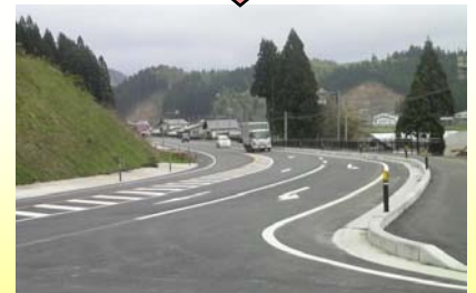
カーブが緩やかになり、見通しが良くなりました

工事期間中は交通規制などご不便をおかけしました。皆様のご協力ありがとうございました。