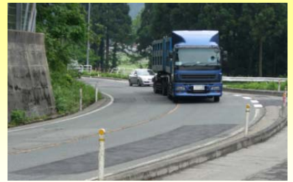
カーブが急で、見通しが悪い状況でした