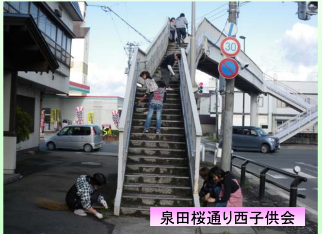
泉田桜通り西子供会