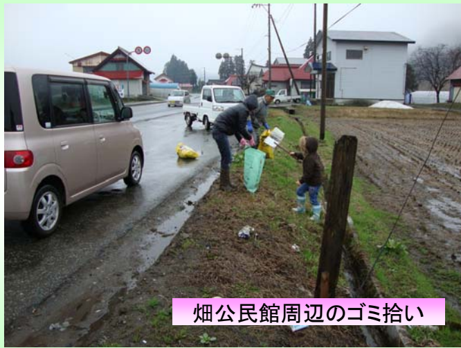
畑公民館周辺のゴミ拾い