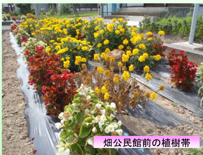
畑公民館前の植樹帯