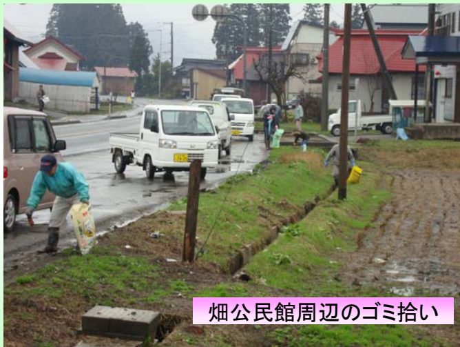
畑公民館周辺のゴミ拾い