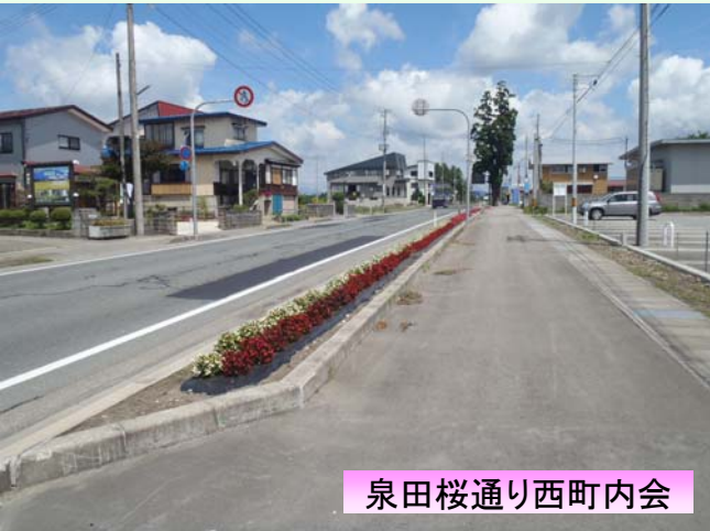
泉田桜通り西町内会