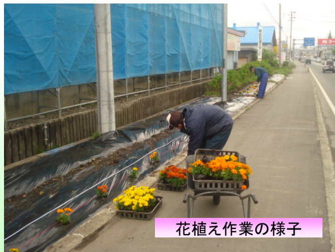
花植え作業の様子

受賞された皆様、おめでとうございます。また、永年のご尽力ありがとうございました。今後ともよろしくお願いたします。