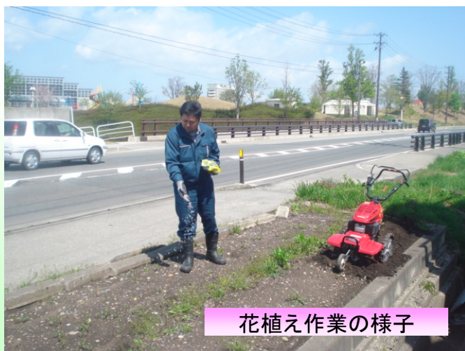
花植え作業の様子