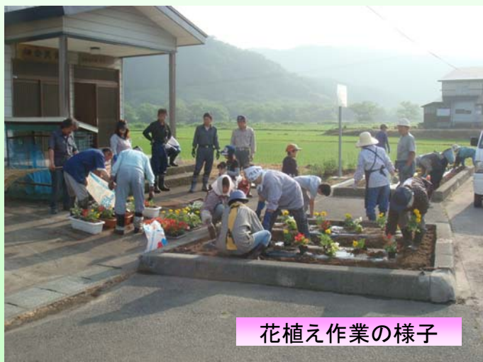
花植え作業の様子