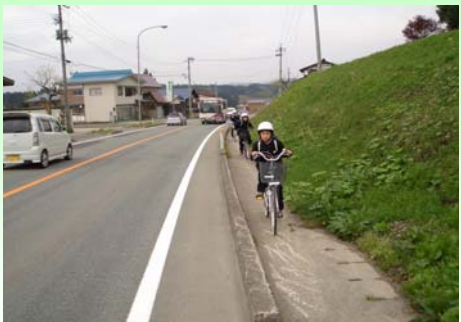
歩道がせまく、歩行者のすれ違いも難しい状況でした