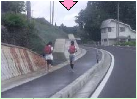
歩道が広くなり、歩行者の安全な通行が確保されました