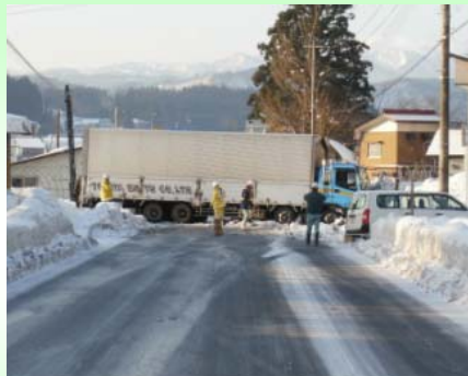
スリップし道路をふさいだ大型車。約2時間全面通行止めとなりました。