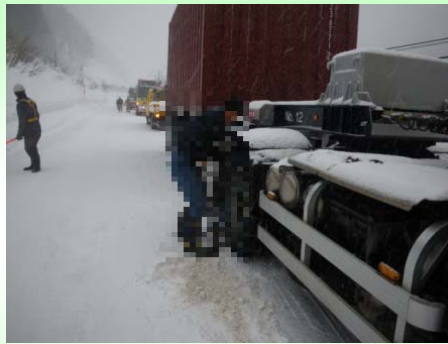
スタックし車道上でチェーンを装着するドライバー。車線がふさがり渋滞が発生しました。